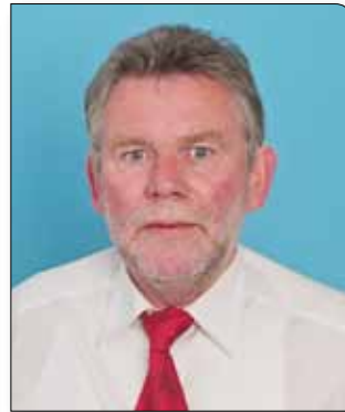
Jan Gerdes Listenplatz 7